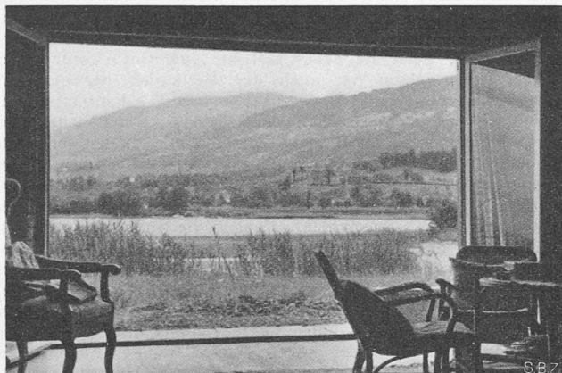
Abb. 4. Blick aus der Stube gegen Lachen und das Wäggital.