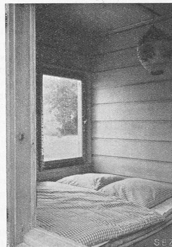
Abb. 6. Im nördlichen Eckzimmer.