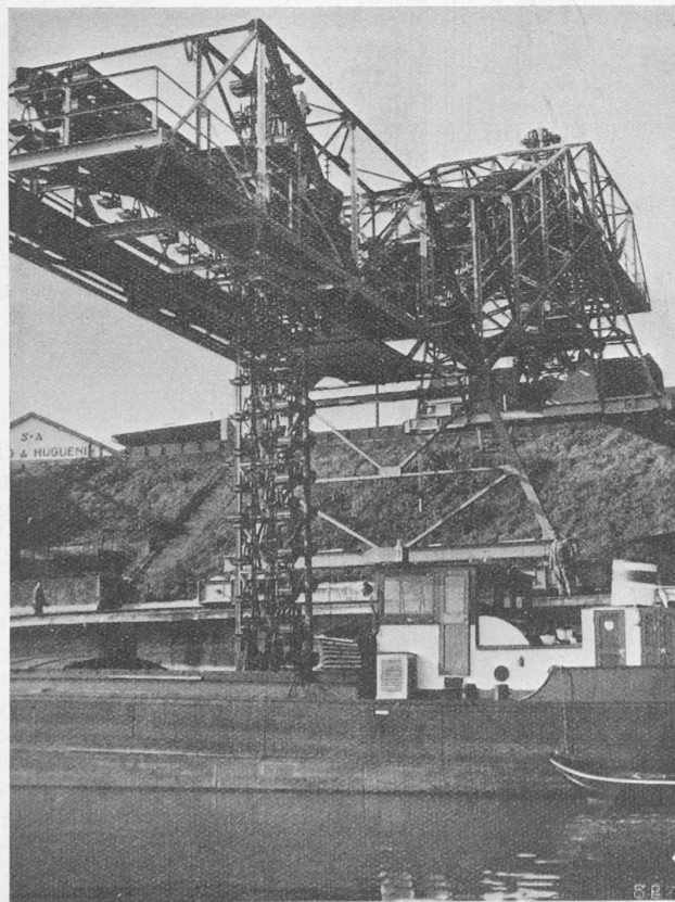
Abb. 3. Gesamtbild vom Rhein aus gesehen.