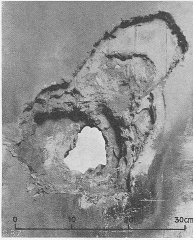
Abb. 2. Durchbrenn-Versuche der EMPA, Wirkung nach 8 h 35 min Brenndauer.

unmöglich, da die aus einem Bankgebäude austretenden Gas- und Rauchschwaden die Nachbarschaft alarmieren würden. Die sich verflüssigenden und vergasenden Mineralien verbinden sich auch teilweise mit dem flüssigen Eisen und entwickeln dabei eine zusätzliche Wärme, sodass die Düse des Schweißbrenners rasch verzerrt, verstopft oder gar abschmilzt, selbst oft dann noch, wenn sie gekühlt wird. — Nach 6 h 20 min war der Gasvorrat erschöpft und damit die erste Versuchsetappe beendet. An der tiefsten