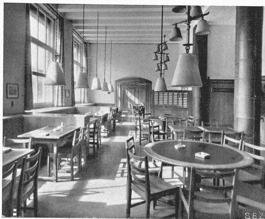
Abb. 6. Wirtschaft, vom Eingang her gesehen.

Die Spezialisten dieses Faches werden ihre Freude haben an den ersten Heften des Jahrgangs 1935 von „Eng. News Record“, die eine ganze Reihe verschiedener grosszügiger Bauten und Installationen zeigen. — Ein Landungsteg in Davenport bei Sta. Cruz an der kalifornischen Ozeanküste, der nur die unbedeutende Belastung von Oel-, Wasser- und Zement-Transportleitungen, aber stärksten Wellenangriff zu ertragen hat, ist ganz aus Eisenkonstruktion, unter mühsamem Kampf gegen Wind und Seegang geschweisst worden. Als Pfähle dienten Rohre, die durch eine Sandschicht in den Schiefer-