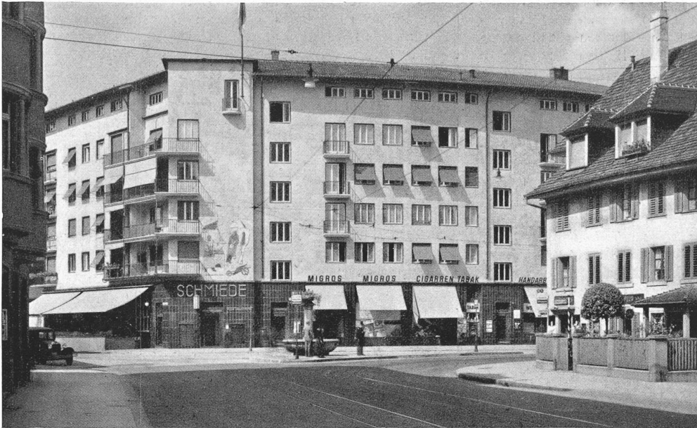
Abb. 2. Der Baublock „Schmiede Wiedikon“ in Zürich. — Arch. Moser & Kopp, Zürich.

grund geschlagen wurden. Nach dem Ausspülen des eingefangenen Sandes rammt man im Innern der Rohre I-Profile noch tiefer und betonierte zuletzt die Rohre aus. — Um die häufigen Ueberschwemmungen von New Orleans zu verhindern, wird dem Mississippi 35 km linksufrig oberhalb der Stadt ein seitlicher Abfluss in den grossen Lake Pontchartrain geöffnet. Dieser rd. 3 km breite Entlastungskanal, der Bonnet Carré Spillway, wird von drei Eisenbahnen und einer Hauptverkehrsstrasse gekreuzt, sodass im Ganzen etwa 12 lfd. km Brücken notwendig werden. Sie sind alle nach dem Gerüstbrückentypus in verschiedenen Baustoffen ausgeführt, auch hölzerne sind dabei, deren Böcke hie und da durch Betonwände ersetzt sind, um der Ausbreitung allfälliger Brände einen Riegel zu schieben. Für die Foundation in dem grundlosen Alluvialboden kamen nur Reibungspfähle in Betracht. Die Strassenbrücke aus armiertem Beton ruht auf Eisenbetonpfählen von 61 X 61 cm Querschnitt und bis 27,5 m Länge. Verladen werden die Pfähle durch einen Portalcran mit Lasttraverse, die den Pfahl an drei Punkten fasst, während er von der Ramme nach der bei diesen Dimensionen üblichen