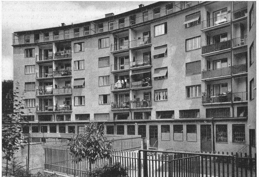
Abb. 3. Hofseite des Hauptflügels. Die breiten Fenster belichten die innern Lagerräume (Schnitt C-D).

Erdgeschosspfeiler und alle Stockwerk-Decken wurden in armiertem