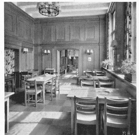
Abb. 7. Saal, Durchblick gegen Restaurant.