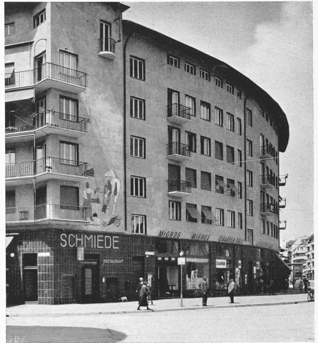
Abb. 4. Läden und Wohnungen im Hauptflügel an der Birmensdorferstrasse.

Der besonders am Stahlbau interessierte Leser findet in den Aufsätzen von Schächterle, Gaber, Schulz-Buchholtz, v. Kazinczy, Bryla und Young einlässliche Darlegungen über den neuesten Stand der Ermüdungsfrage, der Festigkeitsprüfung von Niet- und Schweissverbindungen, in reiner oder gemischter Ausführung, sowie über die Knickfrage. Der im Erwerbsleben tätige Ingenieur wird für diese Arbeiten recht dankbar sein, vermitteln sie ihm doch auf relativ knappem Raum einen willkommenen Ueberblick über die Ergebnisse der sehr umfangreichen Versuchsarbeiten in den Materialprüfungsanstalten. Die Dauerfestigkeit des Stahles und seiner Verbindungen steht dabei im Vordergrund, und die Versuchsergebnisse verdienen erstbeste Beachtung, wenn damit auch ein allzu lebhaftes Vorwärts-