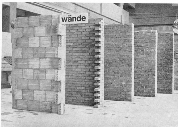
Abb. 1. Gemauerte Wände (Rückseiten verschiedenartig verkleidet).