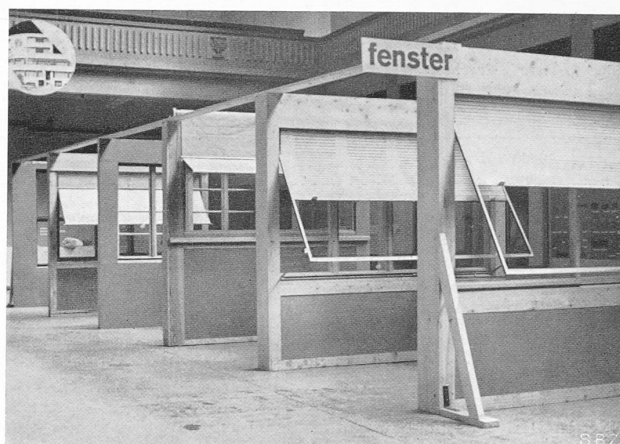
Abb. 2. Fenster (Klapp- und Schiebefenster mit Rolläden und Storen).

bessert werden sollte. Die Abteilung Baubedarf gibt eine knappe Zusammenfassung aller Material- und Konstruktionsarten, wie sie meines Wissens überhaupt noch nie geboten worden ist; diese auch in der Aufmachung originelle Schau hat Arch. P. Artaria durchgeführt. Das gleiche ist von der Abteilung Wohnbedarf zu sagen, der der S. W. B. zu Gevatter gestanden ist. Die von den Herren Dir. Kienzle und Dr. G. Schmidt durchgeführte Abteilung ist auch ausstellungstechnisch besonders interessant. Wenn man der geschickt angelegten Führungslinie nachgeht, so wird sich ob der Reichhaltigkeit unwillkürlich die Frage stellen: wozu eigentlich noch das viele andere, das darüber hinaus fabriziert wird und verkauft werden soll. Ich bin überzeugt, dass man sich der Einsicht nicht verschliessen kann, dass auch hier die Beschränkung im gezeigten Sinne keine Verarmung, sondern vielmehr eine Befreiung bedeuten wird.