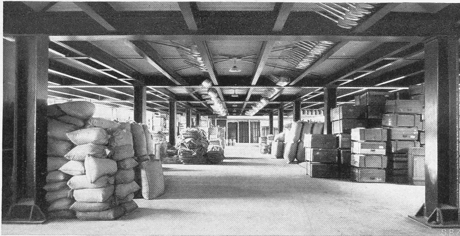
Abb. 6. Erdgeschoss mit Betonboden, oben Holzboden des ersten Stockes.

erbaut 1935 durch Architekt Hans Brechbühler, Bern