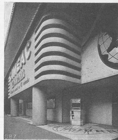
Cinéac Montparnasse, Paris.