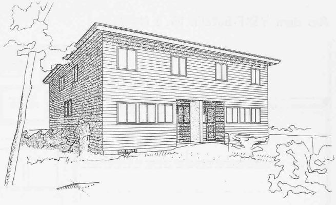
Viererhaus, Typ K.