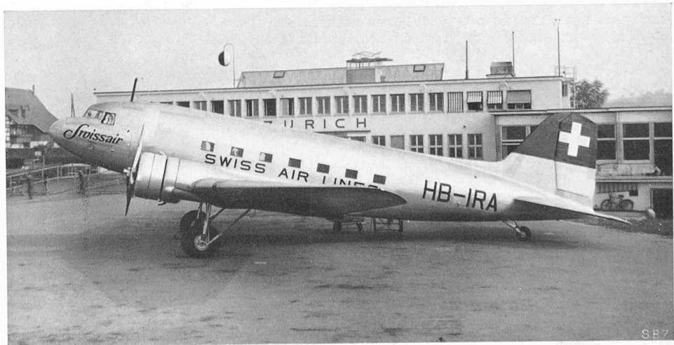
Abb. 9. 21-plätziger Douglas DC3 der «Swissair». 2 × 1000 PS, Reisegeschwindigkeit bis 290 km/h