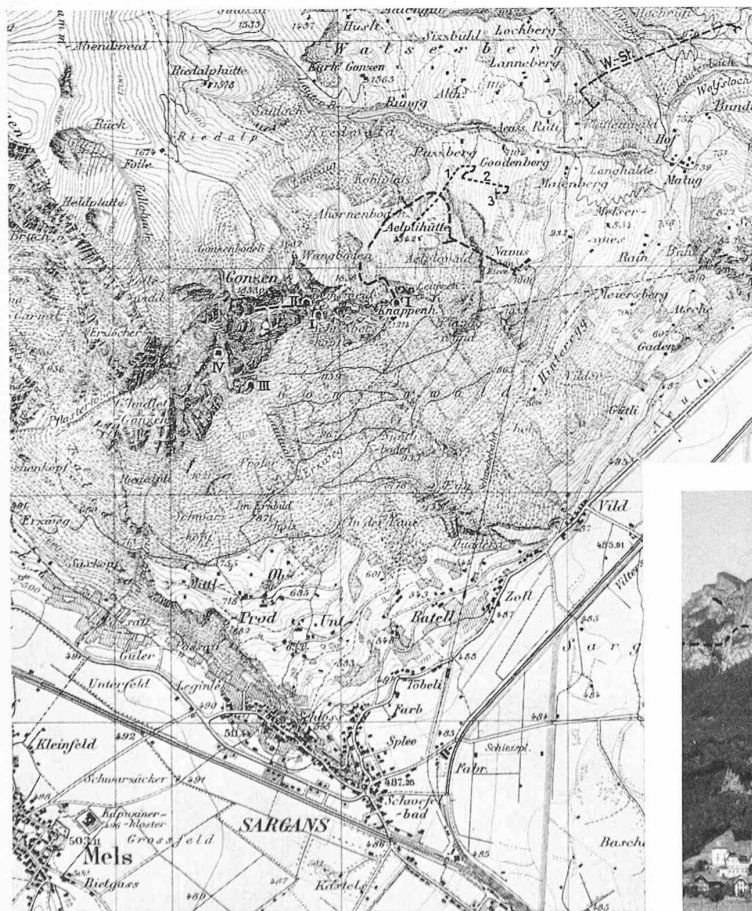
Abb. 1. Uebersichtskarte des Gonzen-Bergwerks. — 1 : 30000 Mit Bewilligung der Eidg. Landestopographie vom 16. Okt. 1937

von Dr. J. Oberholzer (Glarus) und historisch-bergmännischen Beiträgen von Obergeringieur H. Fehlmann (Bern).