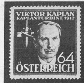
Abb. 2 (rechts). Oesterreichische Kaplan-Briefmarke (1936)

Escher Wyss, Charmilles, Voith, Laufreddurchmesser 7,0 m — Wettingen, 1933, Escher Wyss, verhältnismässig hohes Gefälle 23 m — Marne, Italien, 1935, Charmilles, Gefälle 31,6 m — Vargön, Schweden, Karlstads Mekaniska Werkstad, das grösste Kaplanlaufred der Welt, Durchmesser 8,0 m.