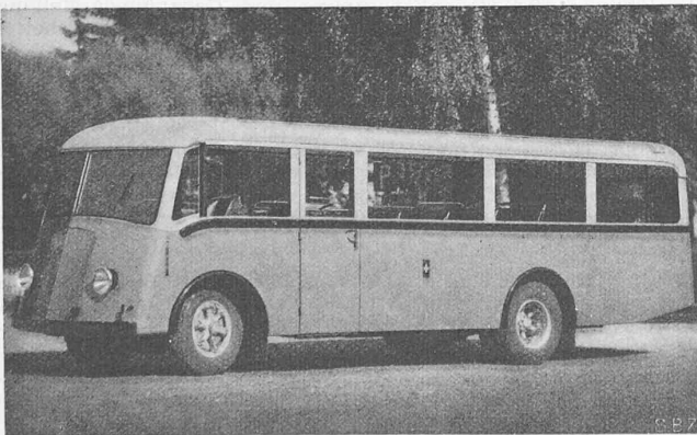
Abb. 50. Neuester Bergpostwagen der Eidg. Post, sog. Walliser Typ