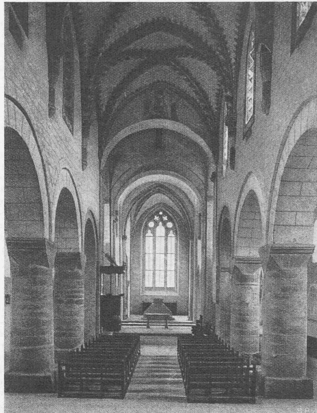
Abb. 4. Mittelschiff von Romainmôtier, im heutigen Zustand

Après divers cours analogues, tenus ces hivers derniers, notre Ecole priera des hommes de premier plan de traiter cet hiver, sous le titre: «Die Schweiz im heutigen Europa» l'adaptation de notre pays à la situation internationale. Depuis l'hiver