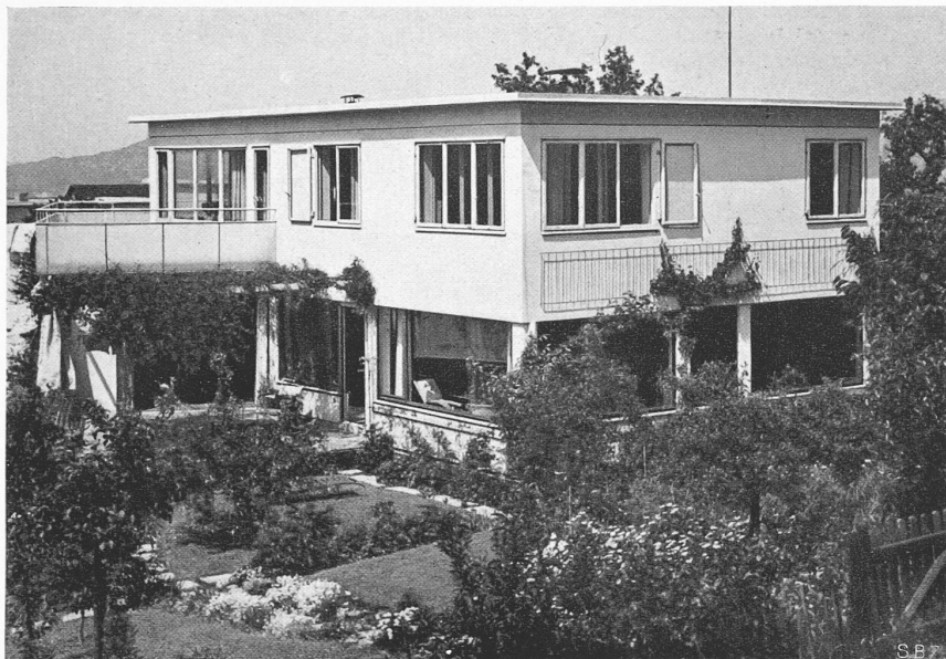
Abb. 5. Gartenseite des Hauses Prof. Dunkel, aus Süden.