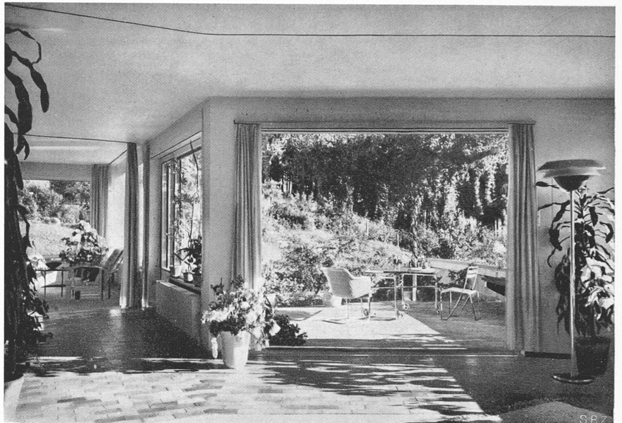
Abb. 9. Wohnzimmer, links Durchgang zum Esszimmer, rechts die Terrasse

durch ergibt sich eine auf die Dauer absolut einwandfreie Radführung und Strassenhaltung. Durch die Pendelachskonstruktion erreicht man im übrigen durch Aufrichtmomente eine Kurvenstabilisierung, sodass das Herausneigen in Kurven vermieden wird. Die Dämpfung übernehmen vorn und hinten hydraulische Stossdämpfer.