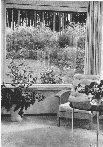
Abb. 8. Blick durch die Gelbglasscheiben des Esszimmers auf den Wald