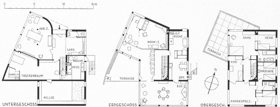
Abb. 2 bis 4. Haus am Lettenholz, Kilchberg (1:350). — Arch. Prof. Dr. W. DUNKEL, Zürich

Die Karosserie wird, entgegen wiederholten Gerüchten, nicht aus Kunstharz, sondern ganz aus Stahlblech hergestellt. Sie besitzt seitlich vier grosse Kurbelfenster und insgesamt zwei Türen. Die Form ist auffallend windschlüpfig, indem alle vorspringenden Teile und schroffen Uebergänge vermieden wur-