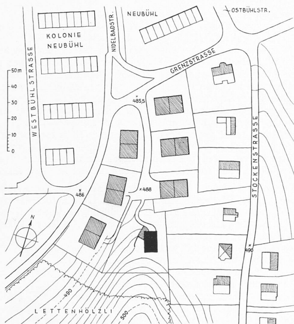
Abb. 1. Lageplan samt Umgebung, Masstab 1 : 2200