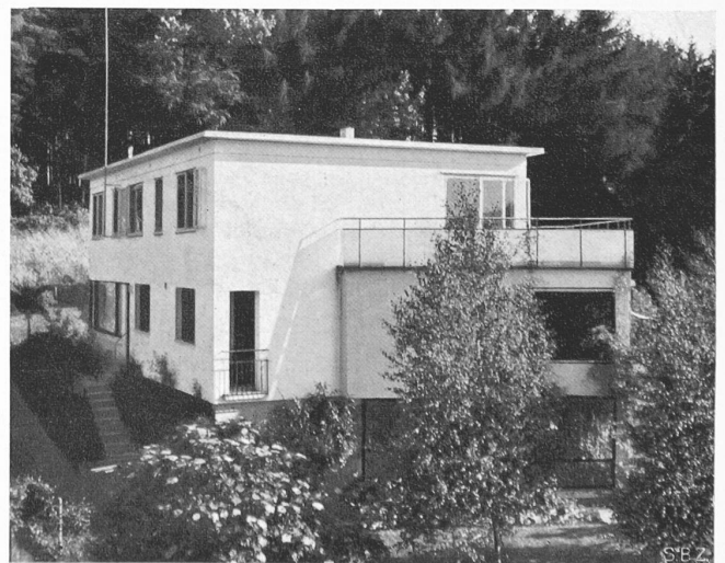
Abb. 7. Nordansicht (Küche und Dienstingang)

Die Serienfabrikation wird nun nach dem erfolgreichen Abschluss der Versuche mit grösstem Einsatz vorbereitet. Vorerst wird jetzt eine Vorserie gebaut, bei der für die Presseleile schon die Gross-Serienmatrizen Verwendung finden. An der Errichtung des Werks in Fallersleben am Mittellandkanal arbeiten