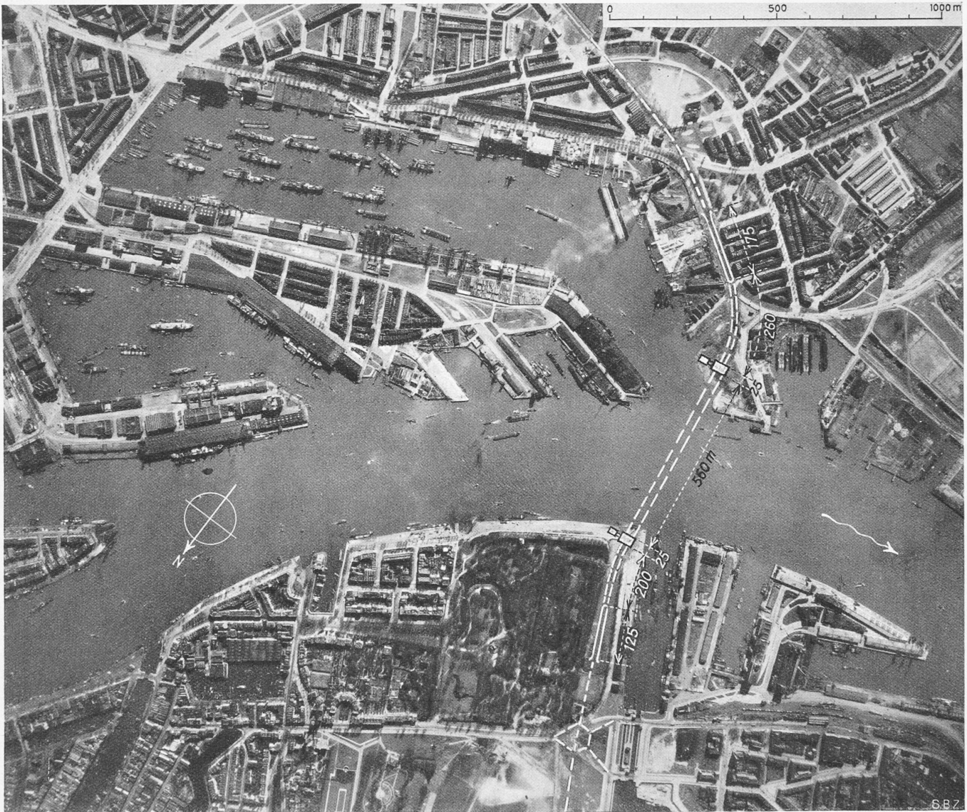
Abb. 1. Rotterdam, Blick auf die Neue Maas mit eingezeichnetem Verlauf des Tunnels und seiner Zufahrten. — Masstab 1: 15000. Das grosse Becken im Südosten ist der Maashaven, das kleinere der Rijnhaven. Links unten der Altstadttrand, rechts davon der Heuvelpark