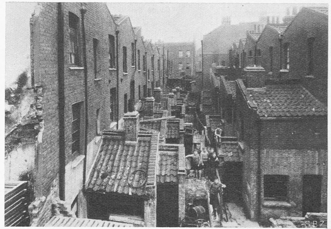
Typisches, heute verschwundenes Londoner Altstadtbild