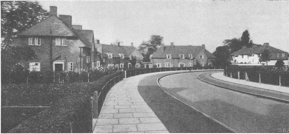
Neue Arbeiter-«Flach»-Siedlung (Einfamilienhäuser) mit Gärten; London County Council

Strahlung ist auf vier Spektrallinien (violett, blau, grün, gelb) konzentriert. Neuerdings sind nun, einem Bericht von J. Guanter im «Bull. SEV» 1939, Nr. 2 zufolge, im Handel Hochdrucklampen erhältlich, die an der Innenseite des Aussenkolbens einen Ueberzug aus einem Leuchtstoff aufweisen. Die Schwächung des ausgestrahlten sichtbaren Lichts durch diesen Ueberzug wird mehr als wettgemacht durch die in ihm bewirkte Umwandlung der unsichtbaren oder schlecht sichtbaren Strahlung in sichtbares Licht beim Aufleuchten (Fluoreszieren) des der unsichtbaren Strahlung ausgesetzten Anstrichs. Das von dem bestrahlten Leuchtstoff ausgesandte Licht ist aber nicht nur sichtbar, sondern auch gemischter und damit dem Tageslicht ähnlicher als das Quecksilberdampflicht. Der Leuchtstoff ist also ein Frequenzwandler, der vielerlei Wünsche zu erfüllen hat: Er soll möglichst 1. gerade auf den erwähnten Spektralbereich um 366\text{ m}\mu ansprechen, 2. das dem Hg-Licht fehlende Orange und Rot in seiner Emission bevorzugen, 3. das sichtbare Hg-Licht wenig absorbieren. In den von der Osram A. G. herausgebrachten Typen (für 3000 und 5000 int. lm) dient Zinksulfid mit einer Beimischung von Kadmium und Kupfer als Leuchtstoff. Die Lichtfarbe der neuen Lampen entspricht etwa einem Mischlicht aus Hg- und Glühlampenlicht im Verhältnis 5:1.