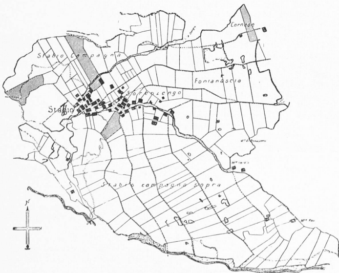
Güterzusammenlegung Stabbio, neuer Bestand: 154 Grundstücke! Der gleiche Besitzer hat jetzt nur noch 4 grosse Grundstücke

Ein Vergleich der Bodenverbesserungs- mit der geologischen Karte der Schweiz ergibt, dass die Entwässerungen in den Gebieten der Flysch-, Molasse- und Kalkformationen der Vor-alpen vorherrschen. Das Studium der jährlichen Verbesserungs-Statistiken zeigt, dass die Ausführungen dieser Meliorationen keinen konstanten Verlauf aufweisen, sondern in Perioden häufiger und grosser Niederschläge unverhältnismässig an Zahl und Umfang zunehmen. Diese Zunahmen haben ihre Ursache weniger im Zweck der Bodenverbesserung, als vielmehr im Zwang, zerstörten Kulturboden wieder in Stand stellen zu müssen, oder gefährdete Heimwesen, Strassen und andere Kultur-