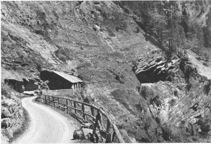
Abb. 3. Alpweg Vättis-Sardona, im Calfeisental; Galerie und Tunnel bei der Gigerwaldplatte