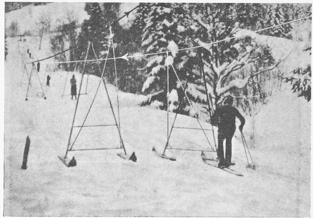
Abb. 1. Skilift in Flühli (Entlebuch) nach System Wullschlegler, bergwärts gesehen (weisses Zugseil bergwärts ziehend)

am Wettbewerb für die Gewerbeschule (siehe «Schweiz. Bauzeitung» vom 25. Juni 1932, 11. Mai 1935, 29. Januar 1938, 15. April 1939). Diese Beispiele wären mit Leichtigkeit zu vermehren.