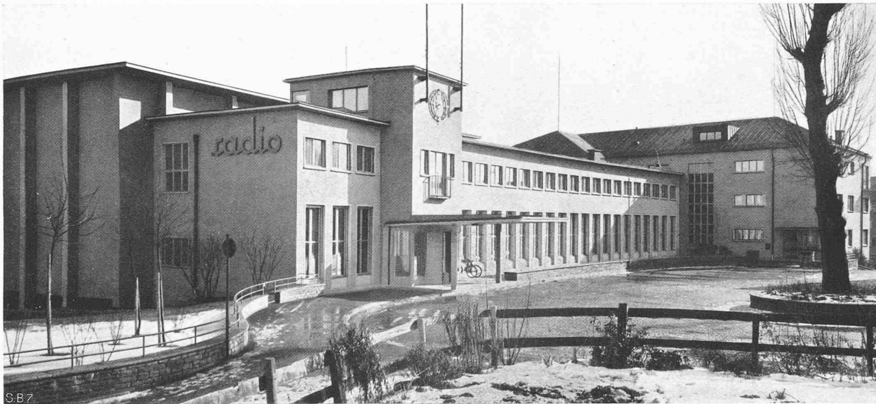
Abb. 1. Vorn links der Erweiterungsbau mit Haupteingang, rechts hinten der querstehende Altbauflügel