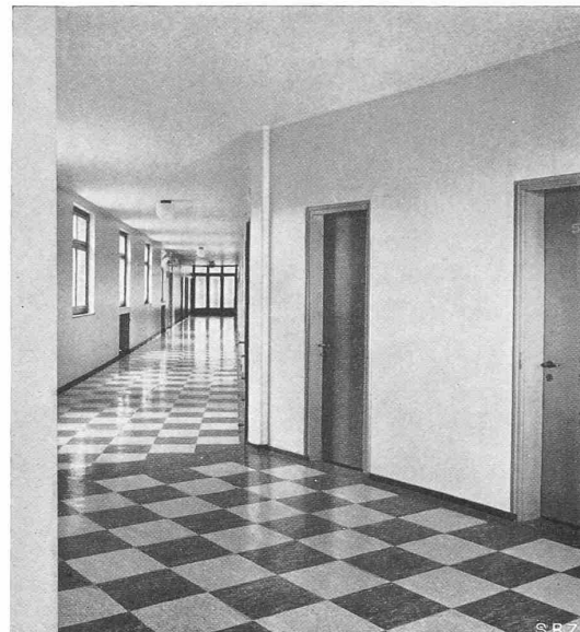
Abb. 12. Korridor des neuen Bettenflügels, vom Lift aus

bemessen, als sie zur Tragfähigkeit der zu übernehmenden obren Lasten zu dienen haben. Für die Isolierung dieser Wände gegen Kälte, Wärme, Raum- und Trittschall wurden nach Fertigstellung der Rohbaumauern Leichtbauplattenwände in Zellton aufgeführt. Die Bodenkonstruktionen sind Eisenbeton-Hohlsteinkörperdecken. Unter den in Felsenit-Mörtel hergestellten Unterlagsböden ist eine Glasseidenmatte eingelegt; damit erhalten wir schwimmende Unterlagsböden für die Aufnahme der Inlaid- und Gummi-Beläge, jene in sämtlichen Patientenzimmern, Tag- und Verwaltungsräumen, diese in den Korridoren und den Vorplätzen. In den Toilettenräumen und Badzimmern liegen Böden in Steinzeugplatten, die Wände sind mit glasierten Wandplatten bekleidet. Die Tragkonstruktion für die Operationsräume über dem Durchgang sind Stahl-Skelett und verkleidet, aussen mit Backstein und innen mit Isolierplatten in Zellton.