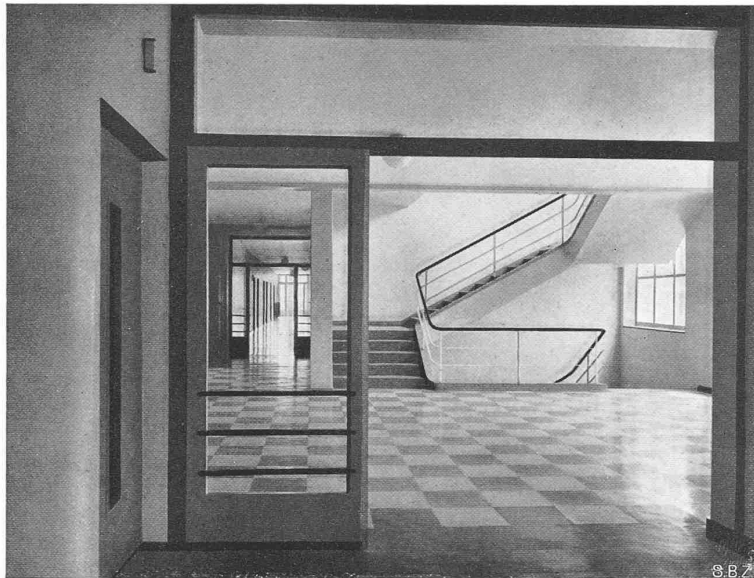
Abb. 13. Treppen-Halle, vom Personen-Lift in den Korridor des Altbaues