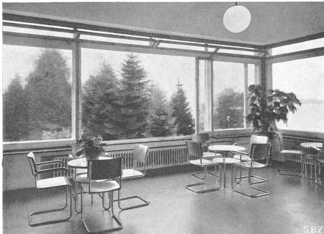
Abb. 14. Tagraum in der Südecke des Neubauflügels