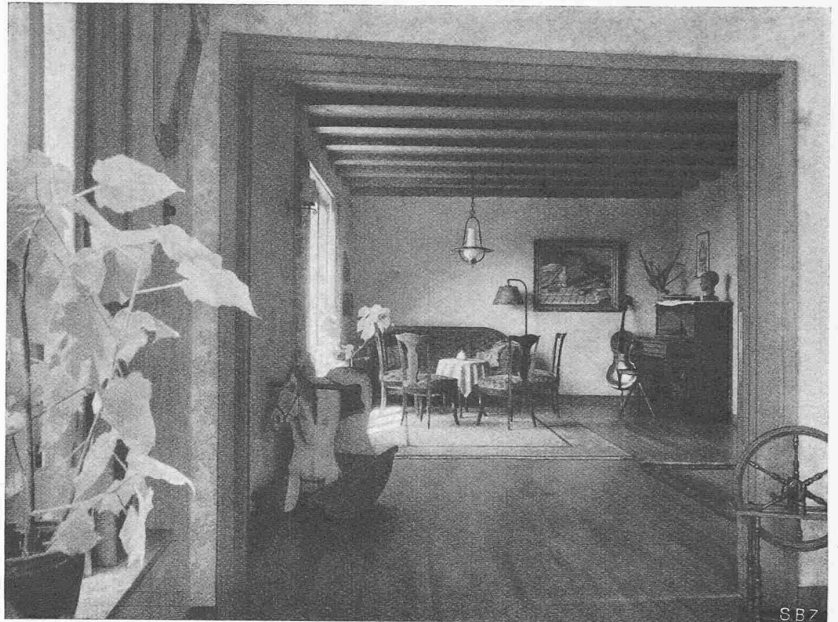
Abb. 3. Blick vom Esszimmer ins Wohnzimmer des Pfarrhauses Wipkingen

Die Berner Fluggesellschaft ALPAR führte im Jahre 1939 ab Bern, Lausanne und La Chaux-de-Fonds den regelmässigen Zubringerdienst nach den drei Eckpunkten des internationalen Luftverkehrs, Zürich, Basel und Genf durch. Ausserdem stellte sie die interne Flugverbindung zwischen den letztgenannten drei Zentren während der Sommermonate her. Das Betriebsergebnis der ersten acht Monate 1939 lässt sich ohne weiteres mit dem Jahresresultat von 1938 vergleichen, da einerseits die Alpar ihr Hauptnetz wie üblich bereits einen Monat später eingestellt hätte, andererseits hat sie erstmalig vom 1. Januar bis 15. April versuchsweise den Winterverkehr auf der Strecke Bern-Zürich aufgenommen. So stieg die Zahl der Kurse der Alpar von 2908 auf 3225 und die der zurückgelegten Flugkilometer von 263408 auf 268892. Recht beachtenswert sind die vermehrten Beförderungsleistungen dieser Gesellschaft. Auf Etappen berechnet nahmen die zahlenden Passagiere von 6348 auf 8564, die Post von 76,8 auf 97,2 Tonnen, die Fracht von 10,8 auf 14,1 Tonnen und das Gepäck von 58,1 auf 73,6 Tonnen zu. Die offerierte Tonnage war zu 33,4% ausgenützt. Die bezahlten Passagier-Kilometer stiegen von 597 003 auf 731 380, die bezahlten Tonnenkilometer von 59 649