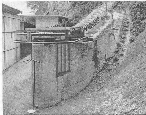
Abb. 2 untere, Abb. 3 obere Umlenkrolle

Strecke Viktoriaplatz—Rosengarten, und darüber hinaus die Strecke über Laubegg zum Bärengraben wären einer guten Frequenz sicher; bei Benzinmangel könnte der Autobus von Ostermündigen nur bis Rosengarten laufen, bei besserer Benzinzufuhr wieder bis zum Bahnhof. Ist einmal der Krieg vorbei, kann die Strecke Bärengraben—Bahnhof immer noch auf Trolleybus umgebaut werden, wenn erwünscht.