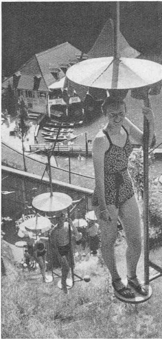
Abb. 1. Ueberblick talwärts