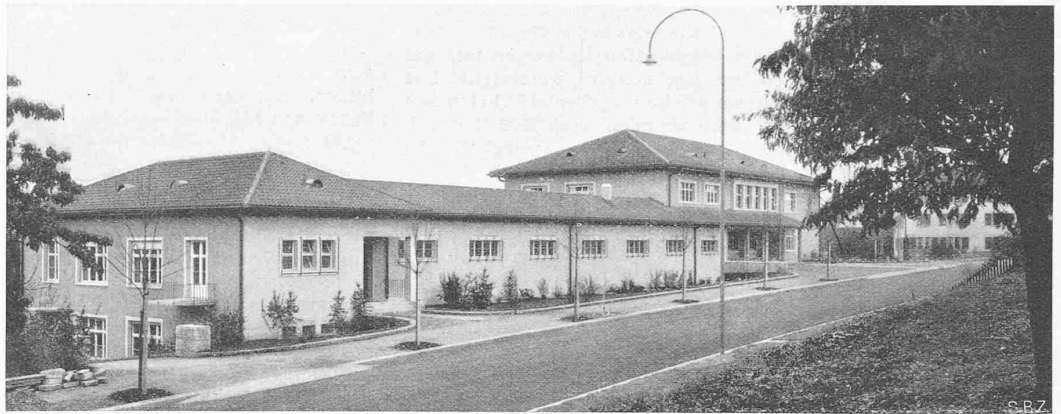
Abb. 2. Ansicht des Bauamt-Flügels, hinten Gemeindehaus, von der Ueberlandstrasse her, aus Südosten

enormen Entwicklung der pflanzlichen Plankter, die dann zu der von Minder am Zürichsee nachgewiesenen interessanten biogenen Entkalkung des Seewassers führt.