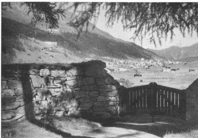
Abb. 22. Davos. Friedhofmauer und schlichtes Holztor, ein Beispiel landschaftsverbundener Bauweise

Die neuen, im Entstehen begriffenen Stadtteile frassen sich da, wo die Bodengestaltung es leicht machte, in die Landschaft hinein und zerstörten rücksichtslos, was die Natur vorher geschaffen hatte. Wenn wir heute trotz grosser Fehler, die die Stadtplanung während der zweiten Hälfte des letzten Jahrhunderts beging, noch gewisse Naturschönheiten im Innern der Städte besitzen, so ist das nicht dem Empfinden der damaligen Stadtplaner zu danken, sondern es hängt nur mit der Schwierigkeit der Erschliessung ungünstiger Geländeformen