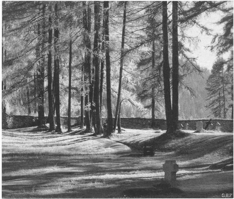
Abb. 21. Trockenmauer, mit Rasenziegeln abgedeckt, im Waldfriedhof Davos, Arch. R. GABEREL

Bestrebungen landschaftsverbundenen Bauens werden zunichte gemacht, sobald die Gräberfelder in die hergerichteten Grünflächen hineinzuwachsen beginnen und die kleinen «Schubladen» mit den Nummern ihre Steine und ihre Begonien erhalten. Aus diesem Grunde sind die hier gezeigten Bilder wohl in Bezug auf ihre Gesamtanlage und Beziehung zur Landschaft ansprechend, ihre gute Wirkung aber wird trotz allerlei Vorschriften über Denkmalgestaltung und Grabschmuck mit der Zeit illusorisch. Das wird nicht besser werden, bevor wir uns entschliessen können, das Einzelgrab nicht als Individuum möglichst kostbar auszugestalten, sondern uns zur vollen Anerkennung der Landschaft bereit erklären, der wir uns wirklich unter- und einordnen wollen.