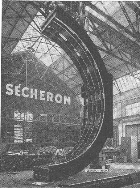
Geschweisste Statorhälfte von 7,60 m Durchmesser für einen 27 500 kVA-Generator.