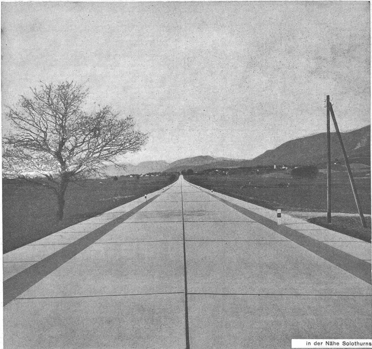
in der Nähe Solothurns