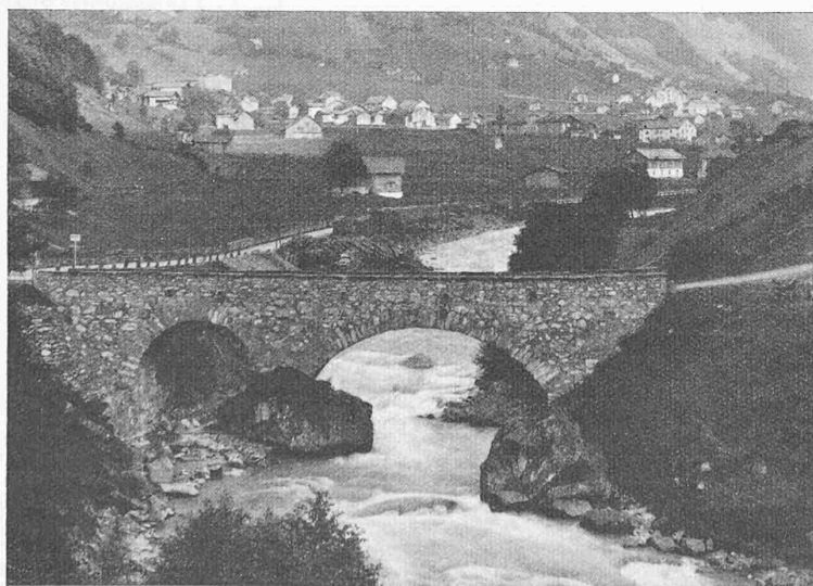
Abb. 8. Alte Sernbrücke bei Engi (Glarus). Vollkommene Einheit zwischen Bogen und Aufmauerung durch Ineinandergreifen der Steine, lagerhaftes Verarbeiten, glatte Ansichtsfläche

Aus jenen Massnahmen und der dadurch bewirkten Versteppung heraus entstanden jene Staubstürme, die den Ackerboden weghlisen, nicht nur in Amerika, sondern auch schon in Deutschland. In den U. S. A. aber hat bereits der Bodenerhaltungs-Dienst eingesetzt (Soil conservation service) und dort ist das Ziel, eine Landschaft zu erhalten oder neu zu schaffen, reich durchsetzt mit Wäldern, Büschen und Hecken, Tümpeln und Weihern, während wir in Störung des Gleichgewichtes der Natur diese nach und nach systematisch mit ungeeigneten Techniken und den Monokulturen vernichten.