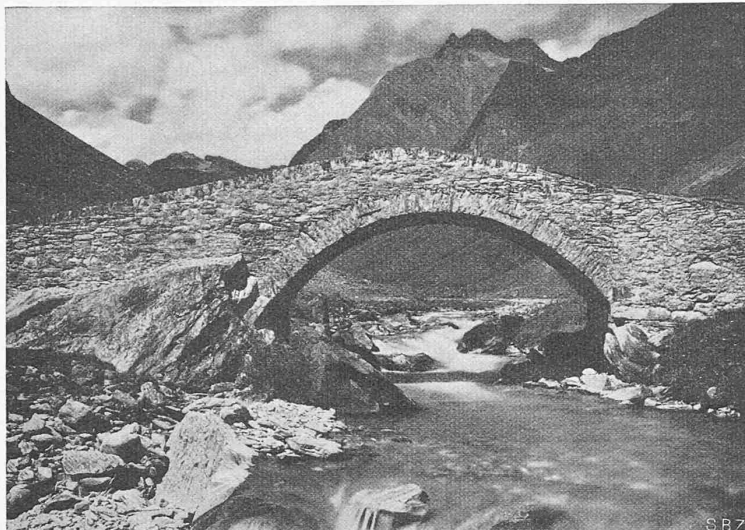
Abb. 9. Alte Brücke am Septimerpass (Graubünden). Plattiges Gestein lagerhaft verarbeitet, Rollschicht und dünne Abdeckplatte als Abschluss der Brüstung

nachher folgen die Rodung der Stöcke und die Erdarbeiten. Durch das Schutzwaldstreifen-Gesetz hat der deutsche Strassenbau die Möglichkeit, bis 40 m zu beiden Seiten des Baues neuen Wald, Waldsäume und weiche Uebergänge in sanften Böschungen zum bestehenden Walde zu bearbeiten. Sorgfältigem Beobachten und natursichtiger Einfühlung gelingt es dadurch, in ganz kurzer Zeit etwas Endgültiges hinzustellen, wie in Feld und Flur draussen, wo die blumige Wiese oder der Acker nicht durch steile Böschungen abgedrängt erscheinen, sondern ohne Wunden und Uebergänge dem Neubau angeschlossen werden.