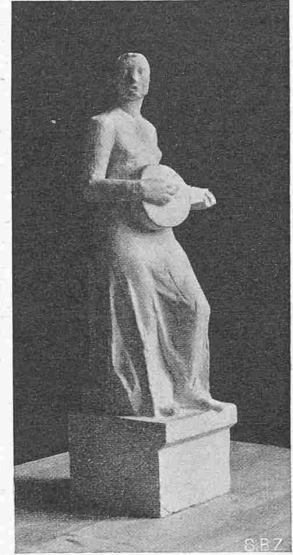
Standort 2, 3. Preis: FRANZ FISCHER