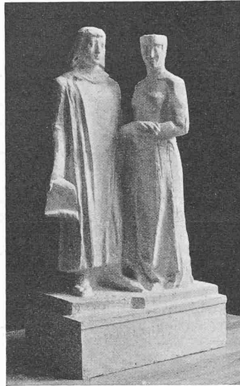
Standort 1, 3. Preis: FRANZ FISCHER