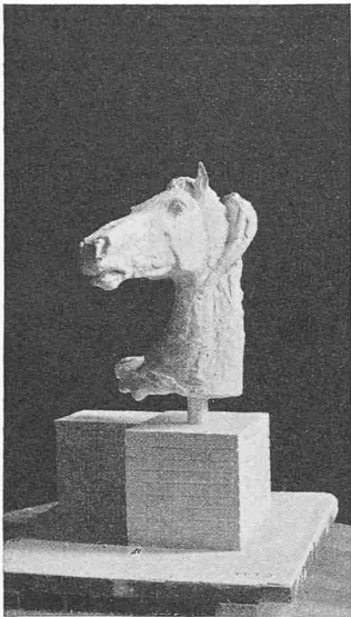
Standort 1, 2. Preis: O. BÄNNINGER