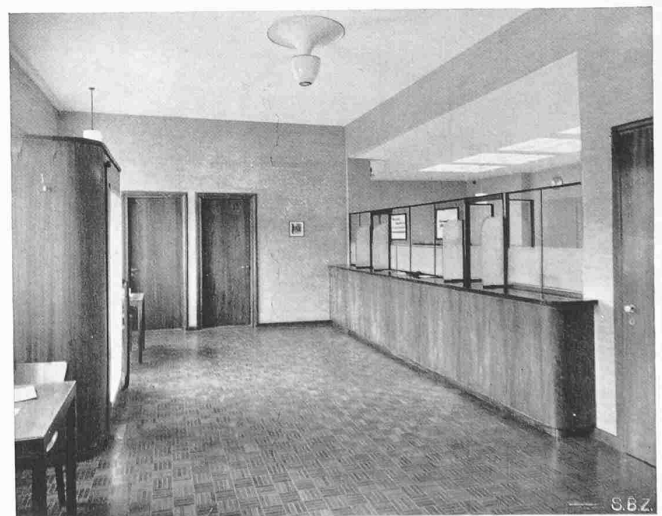
Abb. 5. Schalterhalle der Spar- und Leihkasse Schaffhausen

Zu den einzelnen Punkten auf Seite 241 und 242 von Bd. 119 der SBZ ist folgendes zu sagen: