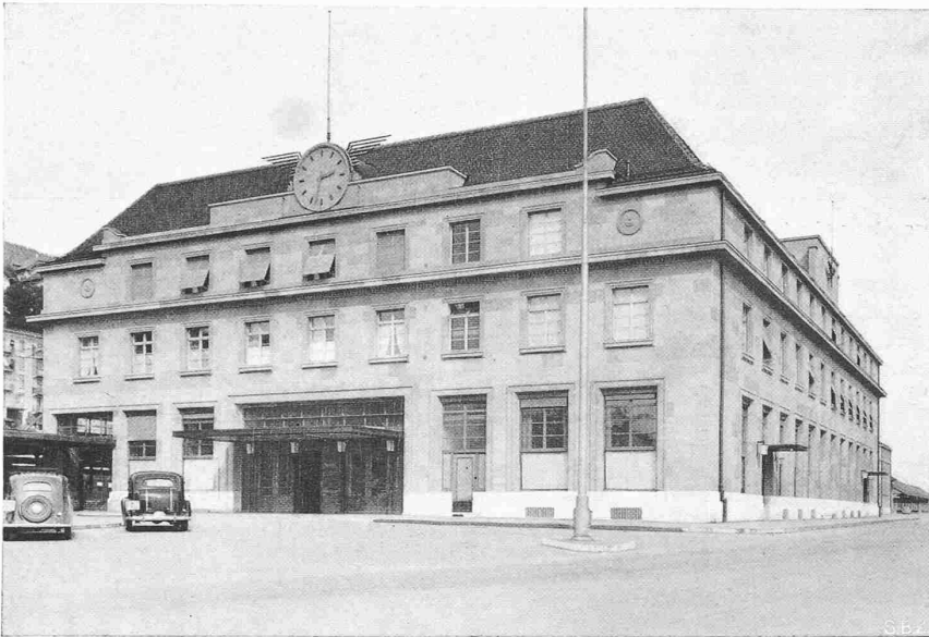
Fig. 2. Entrée principale côté Ouest du Bâtiment aux Voyageurs