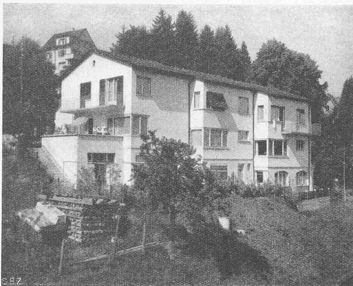
Abb. 2. Aus Südost