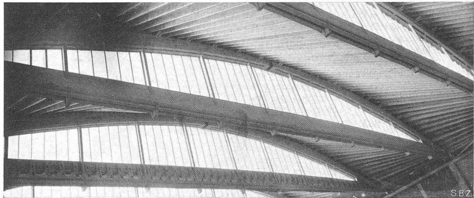
Abb. 2. Untersicht des Daches der Haupthalle VIII (1941/42). Stützweite 45,46 m