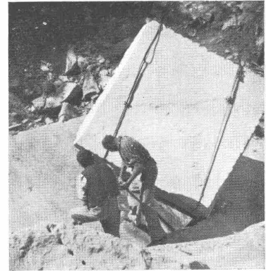
Bild: Hebung einer Podestplatte für die Wasserkirche. Gewicht im Rohzustand ca. 5500 kg.

Rohmaterial für Bodenbeläge, Treppen, Brüstungen, Kanzel und Taufstein