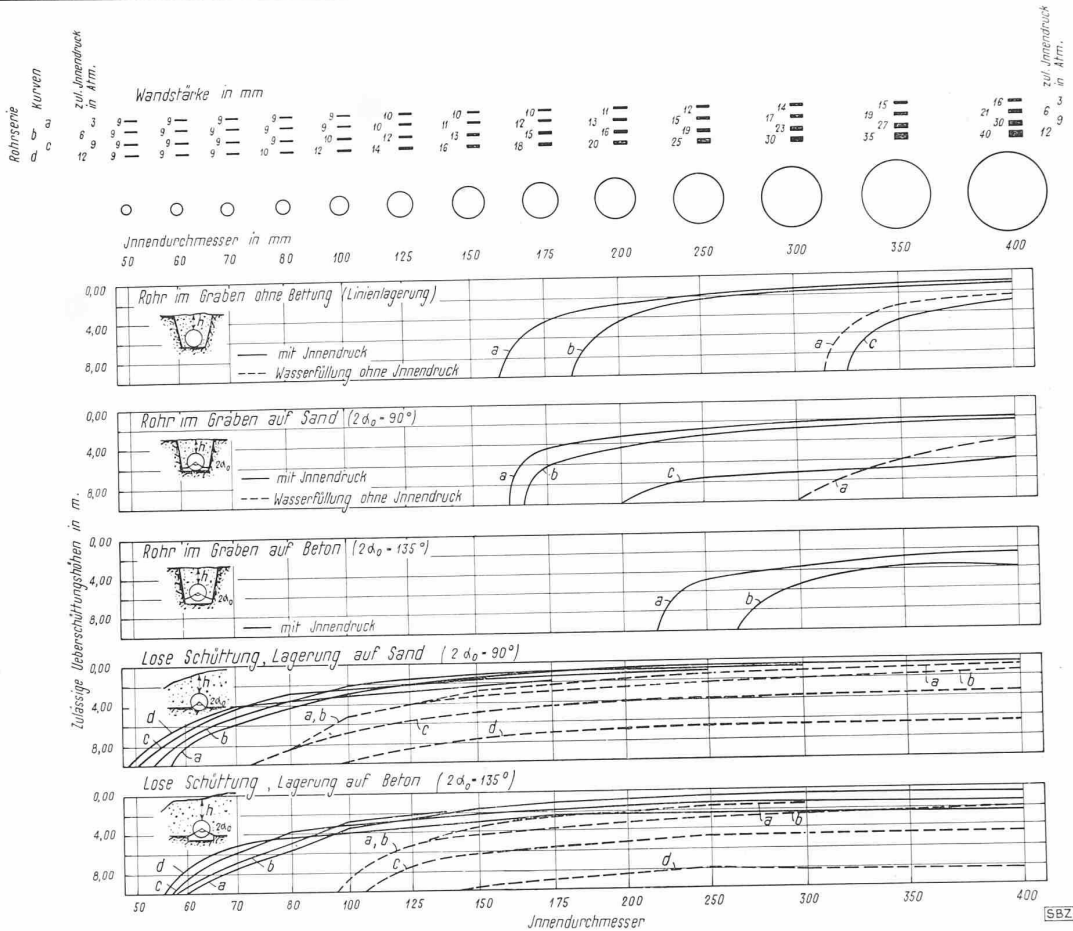
Abb. 21. Zulässige Verlegetiefen für stetig gelagerte Eternitröhren