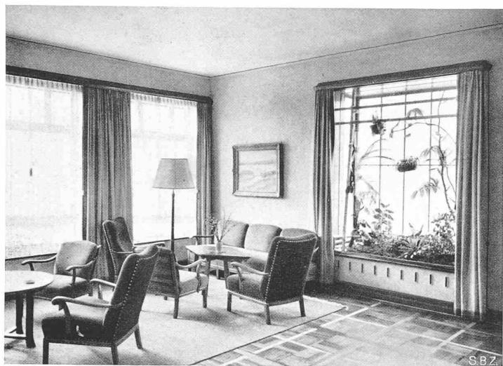
Abb. 15. Sitzplatz im Esszimmer der Direktion, Obergeschoss

Wohlfahrtshaus der SWO, Bührle & Co., Zürich-Oerlikon. — Architekt R. Winkler, Zürich