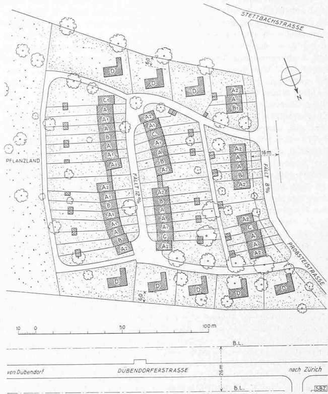
Abb. 1. Obere Gruppe im «Riedacker» der Wohnsiedlung «Sunnige Hof» in Zürich-Schwamendingen Lageplan 1:2000

Wir kommen im nächsten Jahr, wenn das Ganze etwas eingewachsen sein wird, auf die ansprechende Wohnsiedlung eingehend zurück.