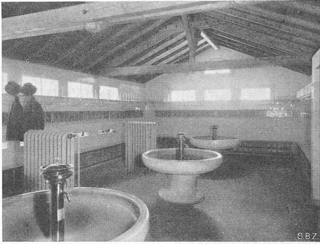
Abb. 3. Wasch- und Duschraum gemäss Abb. 1