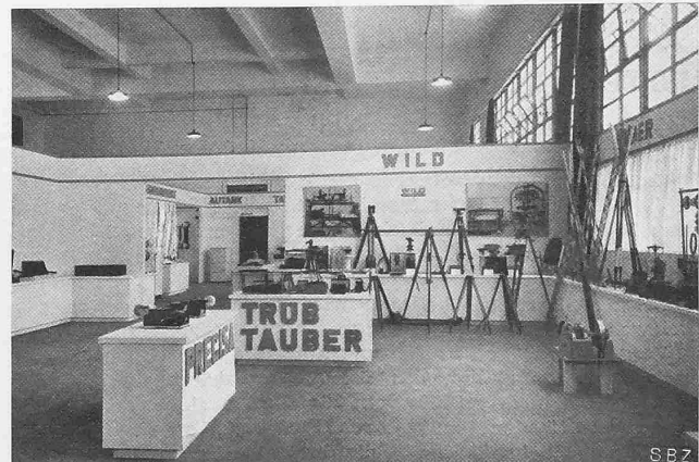
Abb. 23. Nebenraum, Präzisions-Instrumente