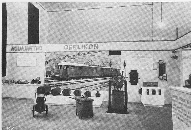
Abb. 22. Nebenraum, elektrische Apparate und Motoren

Arbeitsgemeinschaft S. I. A. - BSA - GAB, Bern. Die unter der Sektion Bern des S. I. A., der Ortsgruppe Bern des BSA und der Gesellschaft selbständig prakt. Architekten und Bauingenieure Berns (GAB) seit zwei Jahren bestehende Arbeitsgemeinschaft, die vor allem durch Bearbeitung stadtbaulicher Fragen im Interesse der Stadt Bern fruchtbare Arbeit leistet, hat in der letzten ordentlichen Versammlung des geschäftsleitenden Ausschusses ihren Vorstand neu bestellt. Für den turnusgemäss zu-