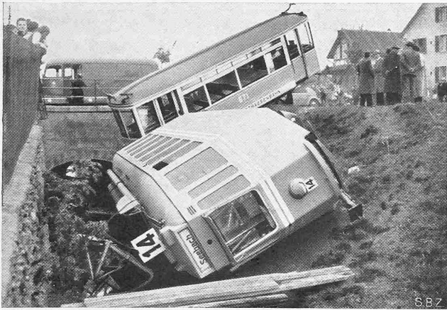
Abb. 5. Umgestürzter Vierachser Nr. 359, samt Anhänger