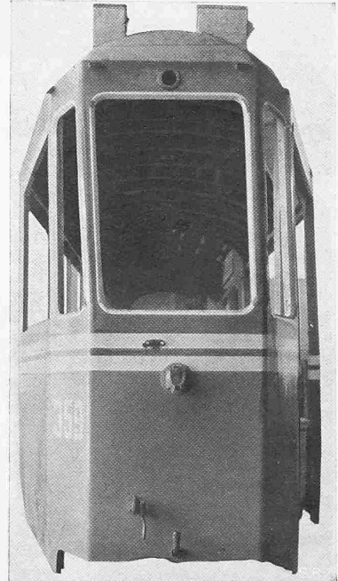
Abb. 7 (rechts). Rückansicht Nr. 359, oberer Wagenteil leicht nach links gedrückt