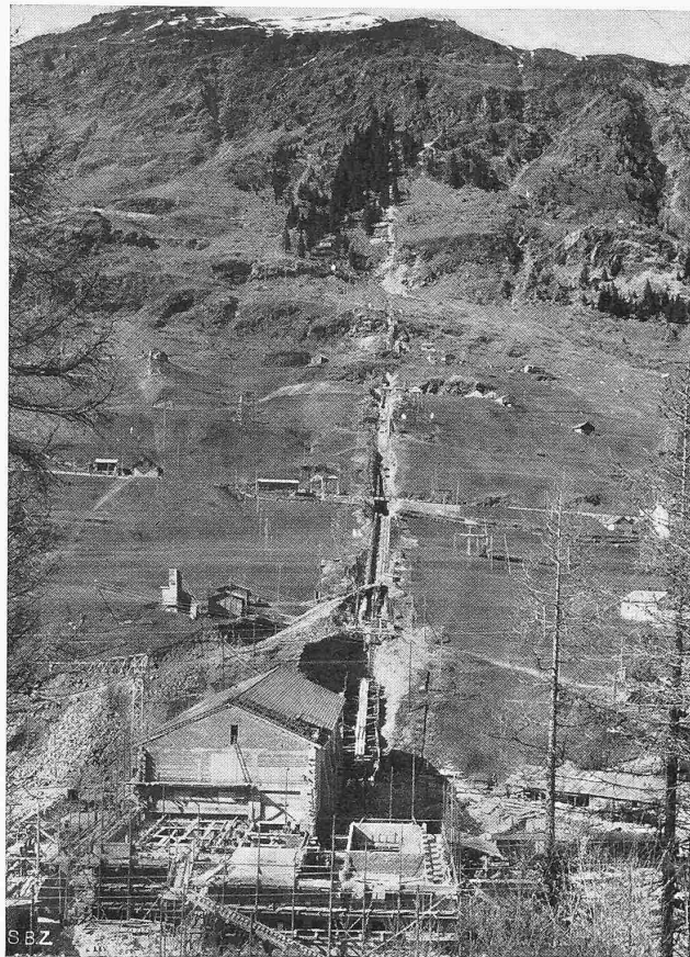
Abb. 14. Druckleitung und Zentrale aus Süden