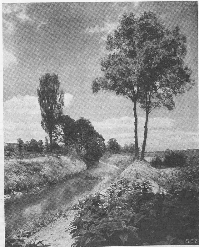
Abb. 4. Durch leichte Schmiegun g des Laufes und Schonung der Vegetation fügt sich auch ein korrigierter Bachlauf ins Landschaftsbild