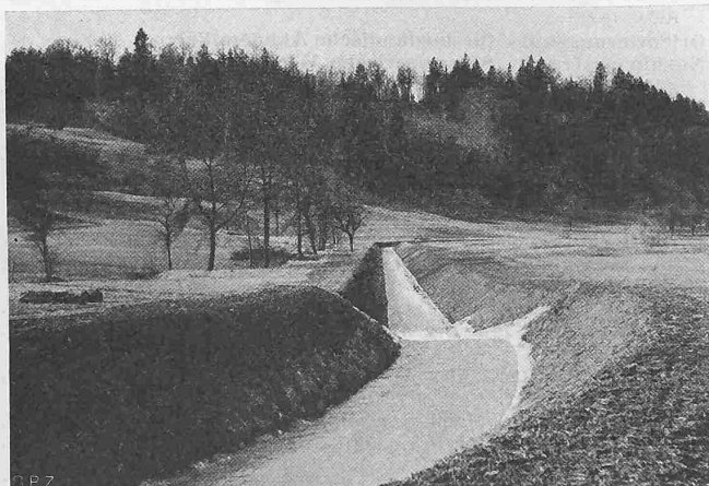
Abb. 3. Alte Schule, Gegenbeispiel: in Grundriss und Längensprofil schematische, rücksichtslose Trassierung einer Bachkorrektur

Mit Nachdruck betonte auch Dir. Keller, dass es die notwendigerweise immer begrenzte Leistungsfähigkeit der Uebertragungs- und Verteilnetze verhindere, auch aussergewöhnlichen