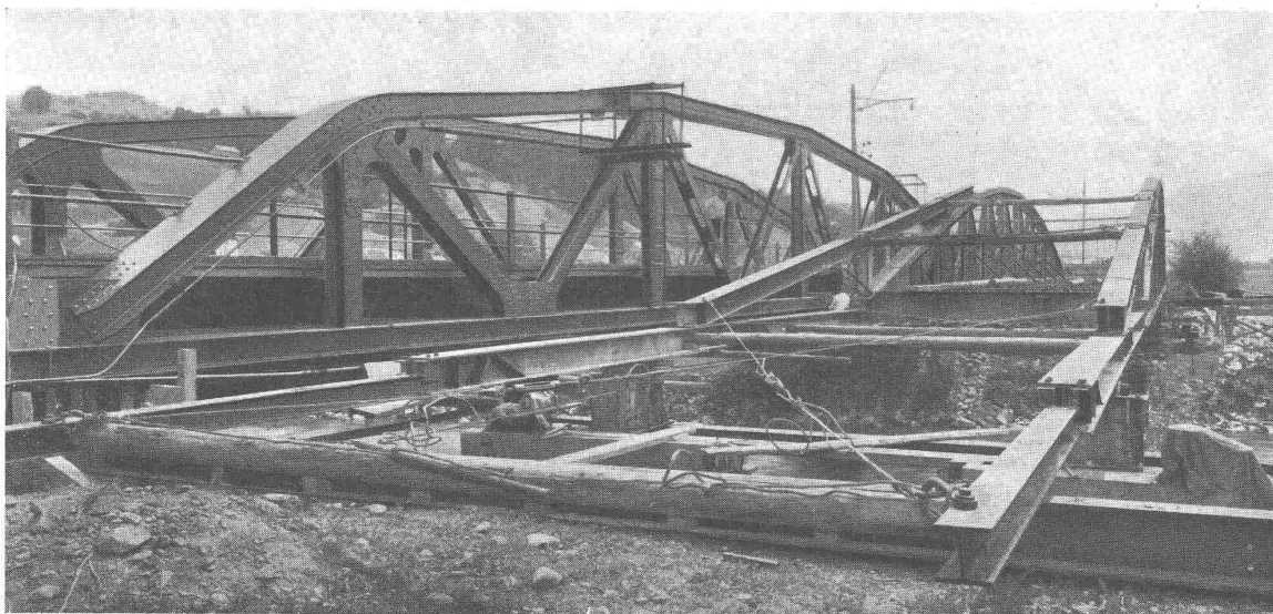
Thurbrücke Ullsbach SBB-Strecke Wattwil-Nesslau

vorn die längsverschobene alte Brücke, dahinter die in Betrieb genommene neue Brücke