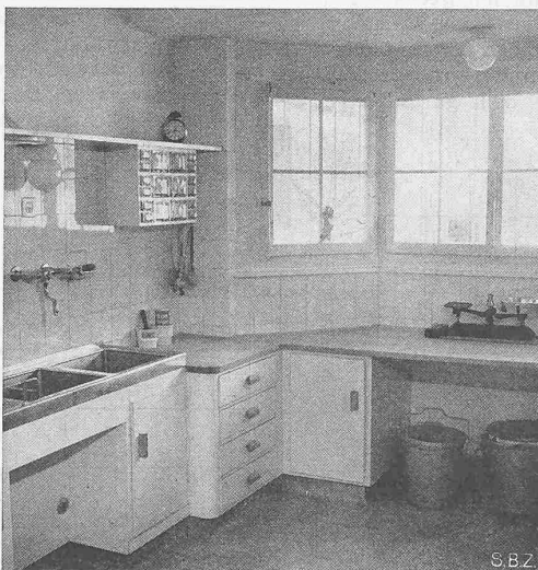
Abb. 6. Küche

Am 2. Juni 1945 hielten in Zürich Vertreter folgender Körperschaften eine Aussprache über die Möglichkeiten zur Koordination gleichgerichteter Bestrebungen: Akademische Studiengruppe der G. E. P., Geograph. Institut der Universität Zürich,