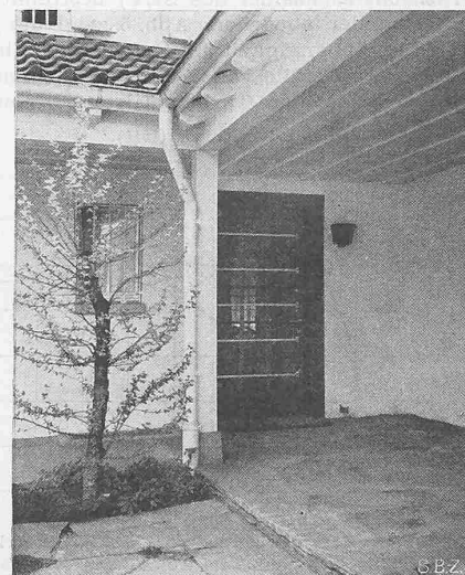
Abb. 5. Haustüre