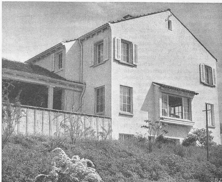
Abb. 2. Haus Dir. Dr. D. in Muttens, Westseite

gen, dass auf diese Weise genügend genaue Bestimmungen möglich sind. Die praktische Bedeutung dieser Messungen erkennt man aus Abb. 8, auf der die Tagesmittel des Gesamtwirkungsgrades des Werkes Innertkirchen aufgetragen sind. Durch die fortschreitende Erosion der Nadeln und Düsen der Turbinen sank der Wirkungsgrad bis zum Punkt a, um nach Auswechseln dieser empfindlichen Organe um volle 4% auf 87,5% (Punkt b) anzusteigen. Wenn man bedenkt, dass 1% Wirkungsgradverbesserung eine jährliche Mehrproduktion von 3,7 Mio kWh bedeutet, so erscheinen die Aufwendungen für die zu dieser Betriebskontrolle erforderlichen Messinstrumente sehr wohl gerechtfertigt.