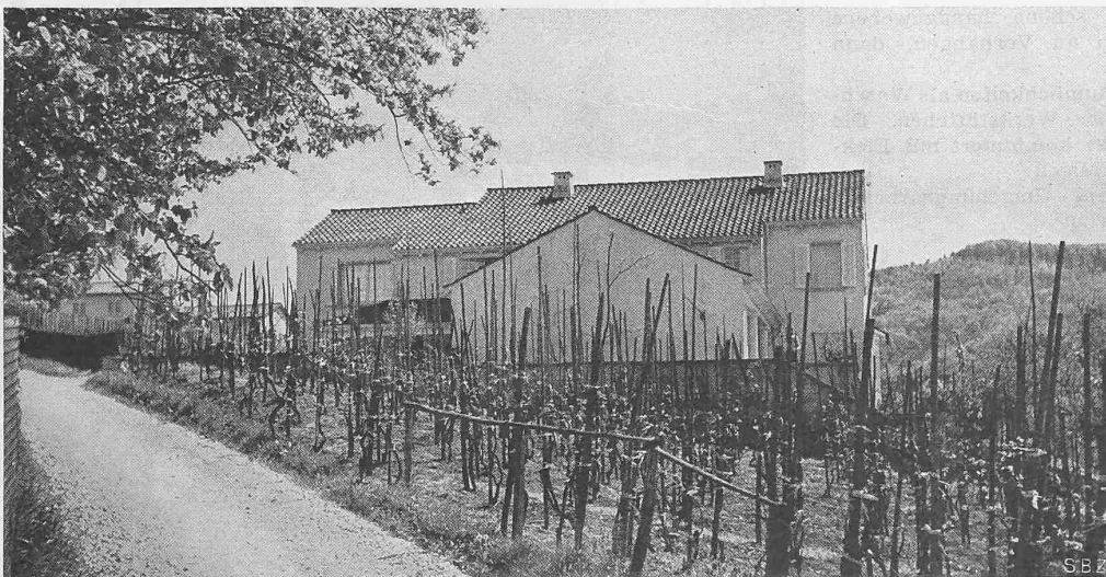
Abb. 4. Zufahrtstrasse und Nordseite des Hauses Dir. Dr. D. am Wartenberg

In der Diskussion haben sämtliche Redner dem Wunsche nach einer engern Zusammenarbeit im Sinne einer Koordination der Ziele Ausdruck gegeben. An sehr eindrücklichen Beispielen aus ihrer Tätigkeit haben verschiedene Vertreter von Fachverbänden die Notwendigkeit der Zusammenarbeit überzeugend dargetan. Ausserdem bot sich Gelegenheit, den gegenseitigen Standort genauer zu bestimmen und vor allem darüber Klarheit zu schaffen, dass die V.L.P. nicht jedes Teilgebiet der Planung selber behandeln will, sondern dass sie ihre Aufgabe hauptsächlich darin erblickt, die Ergebnisse der Teilarbeiten, die notwendigerweise einseitig orientiert sind, zu einem grossen Ganzen zusammenzufassen. Die V.L.P. wird beim ersten möglichen Fall versuchen, diese Koordination praktisch spielen zu lassen, d.h. sie wird bei einer komplexen Aufgabe an die Fachverbände gelangen, damit sie sich über ihre Interessen äussern, um hierauf in einer freien Zusammenkunft zu versuchen, diese Interessen einander anzugleichen.