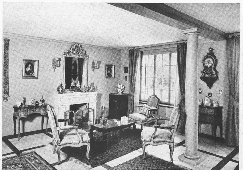
Abb. 2. Salon, Kaminecke

Der bekannte Mathematiker und Pädagoge F. Klein sagt in seinem Werke: «Elementarmathematik vom höheren Standpunkt aus» (1924): «Freilich war den alten Mathematikern bei diesen Begriffsbildungen nicht wohl zumute und ihr schlechtes Gewissen trat in Namen wie erdachte Zahlen, falsche Zahlen usw. zutage, die sie den negativen Zahlen gelegentlich gaben. Aber trotz allen Bedenken finden die negativen Zahlen im 16. und 17. Jahrhundert wegen der sich zeigenden Anwendbarkeit mehr und mehr Anerkennung; viel dazu beigetragen hat ohne Zweifel die Entwicklung der analytischen Geometrie. Allerdings, die Bedenken bleiben bestehen und mussten hier bestehen bleiben. Im Zusammenhang