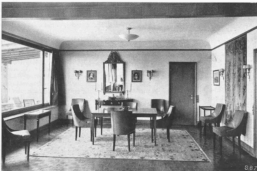
Abb. 2. Esszimmer