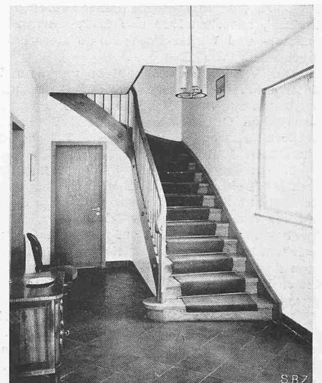
Abb. 3. Halle mit Treppe