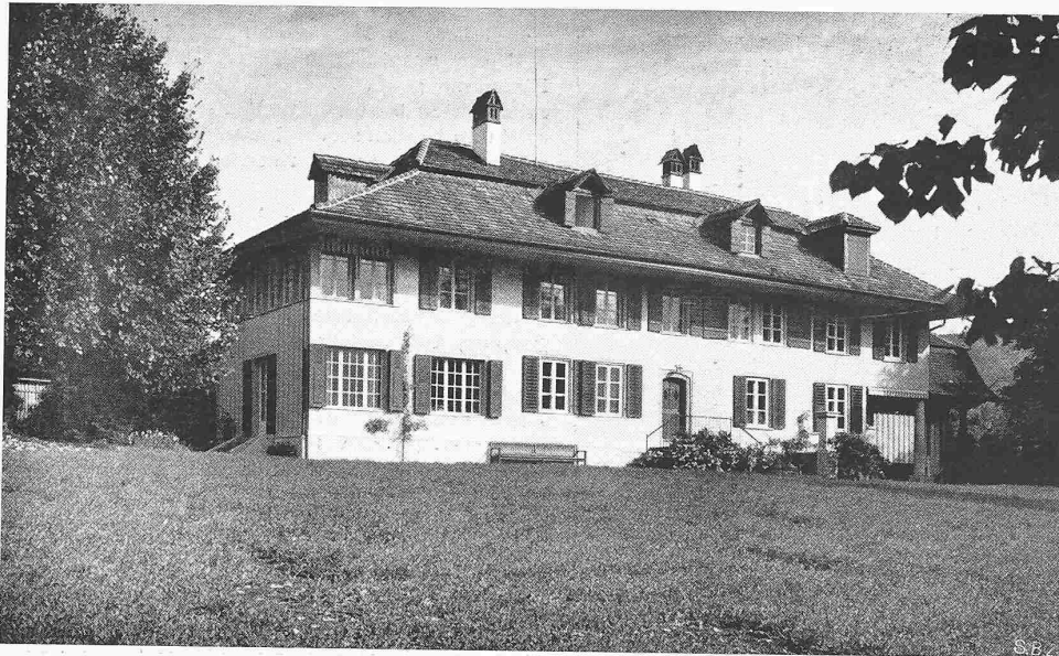
Abb. 1. Der umgebaute Landsitz «Mannenberg» in Ittigen bei Bern, aus Südwesten

eigentliche Wohnteil erhielt eine Wandbekleidung in eichenfurnierten Sperrholzplatten, die Faltwand besteht aus demselben Material und die weiss getünchten und hell uni tapezierten Wände des Essraumes wurden durch eichene Tapetenleisten und helle Eichentüren mit dem Wohnraum in Zusammenhang gebracht. Im übrigen war der Ausbau des Hauses erstklassig ausgeführt, mit reichlichen sanitären und elektrischen Installationen versehen und mit einer separaten Diensttreppe ausgerüstet, die Küche und Office mit den Schlafräumen der Mädchen im I. Stock verbindet. Die Baukosten beliefen sich inklusive Architektenhonorar und Täfer, aber ohne Umgebungsarbeiten auf 72 Fr. pro m 3 umbauten Raum.