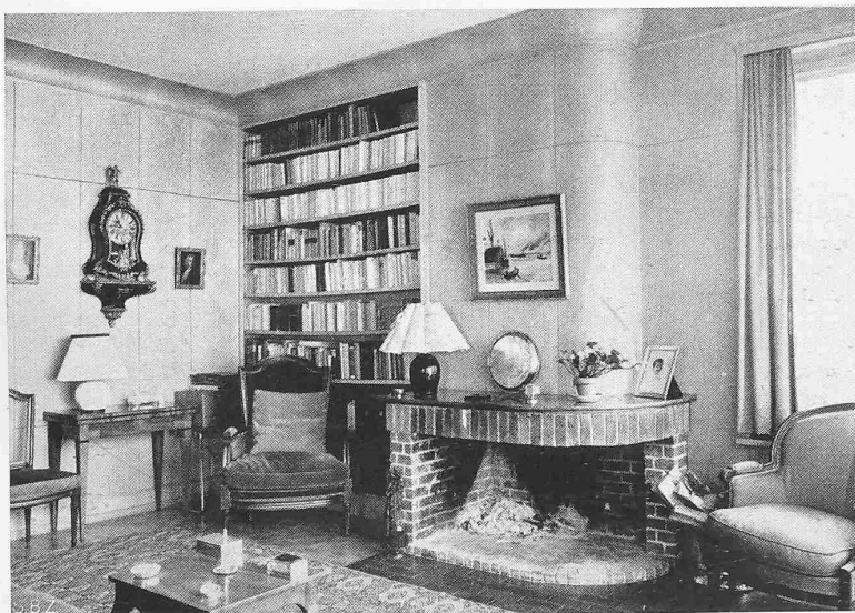
Abb. 6. Wohnzimmer, Kamin

Wohn- und Esszimmer sollten einen einzigen grossen Raum bilden, der nur ausnahmsweise zu unterteilen war. Dies wurde durch eine grosse Fallwand erreicht, die normalerweise beidseitig zurückgelegt und zusammengeklappt werden kann. Der