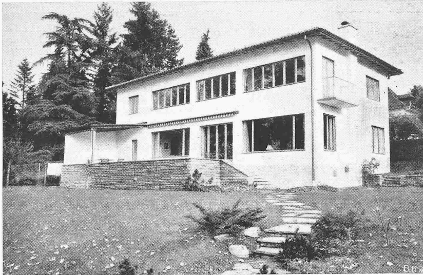
Abb. 4. Ansicht von Südosten