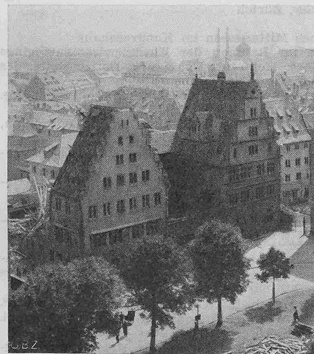
Abb. 3. Frauenhaus vom Münster aus gesehen: Ostflügel teilweise zerstört, Westflügel (mit Renaissancegiebel) erhalten

1) Vergl. «Die Wiederherstellungsarbeiten an der Kathedrale von Reims» von Peter Meyer in SBZ Bd. 89, S. 47* (1927).