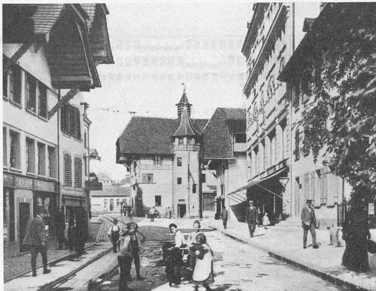
Bild 1. Bahnhofstrasse Aarau, Blick gegen die alte Mühle

Die Gemeindeversammlung vom 10. Dezember 1945, die von 2000 Stimmbürgern besucht war und bei brechendem vollem Saale im Laufe von viereinhalb Stunden 13 Traktanden behandelte, beschloss jedoch nach energisch gehandhabter Diskussion mit 1155 gegen 751 Stimmen (in geheimer Abstimmung!), entgegen dem Antrag des Stadtrates, die Bahnhofstrasse nordseitig zu verbreitern, was den Abbruch der «Alten Mühle» zur Voraussetzung hat. An der Aussprache hatte auch im Namen des Ingenieur- und Architektenvereins ein Befürworter der Erhaltung des historischen Baues das Wort ergriffen. Das «Aargauer Tagblatt» erklärt in Nr. 292 vom 11. Dezember 1945 in seinem Bericht über die sehr bewegte Versammlung, der Entscheid in der wichtigsten Angelegenheit sei sehr unbefriedigend und er sei aus dem Handgelenk gefällt worden. Ueber die finanziellen Konsequenzen könne sich kein Mensch ein richtiges Bild machen, weil