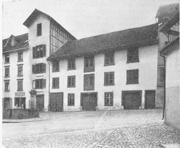
Der «Tümpfel» in Bischofszell, links schlecht erneuert, rechts im früheren Zustand

Abteilungen in dreigeschossigen Bautrakten zu einer harmonischen Gesamtanlage zusammenzufassen. Die Fassaden, die einen wohllichen Charakter wahren, sind sehr gut. Bemerkenswert ist auch die Führung der obren Waidstrasse dem Waldrand entlang in der Richtung gegen die Wirtschaft Waid.