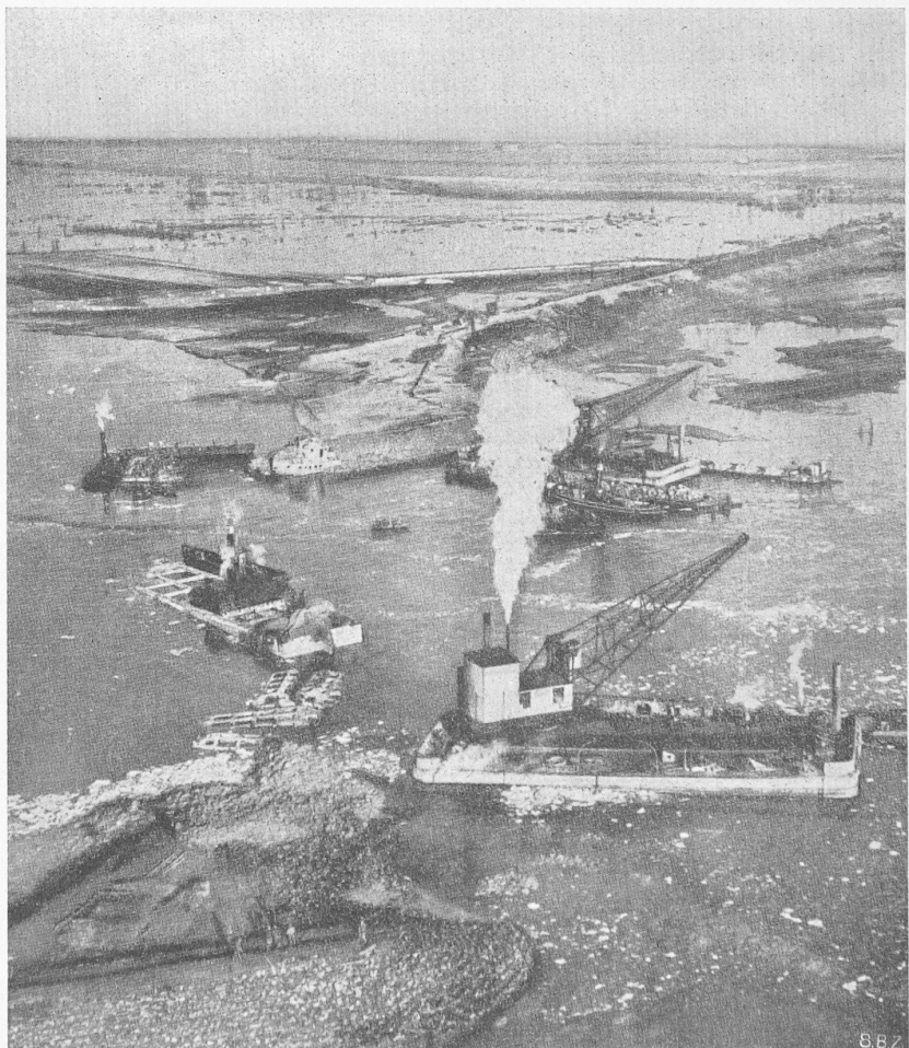
Walcheren. Schliessung der vierten (im Text nicht behandelten) Lücke bei Rammekens (östlich von Vlissingen) nach «De Ingenieur» vom 19. 4. 46