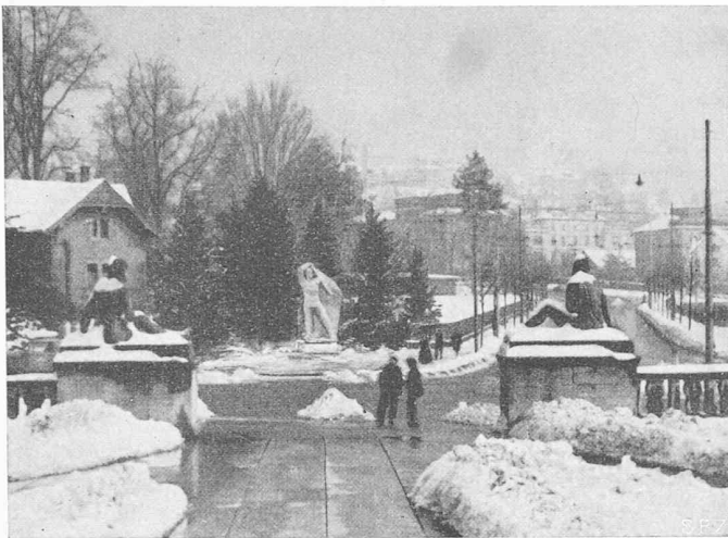
Aufstellung der Figur in der Axe des Universitäts-Eingangs nach Vorschlag W. S.